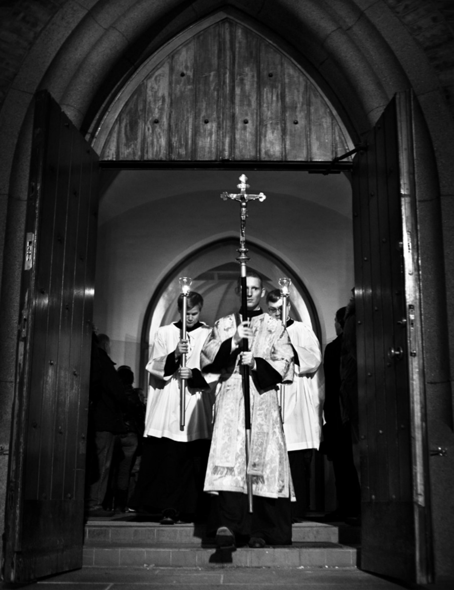
Prosesjon i Den norske kirke