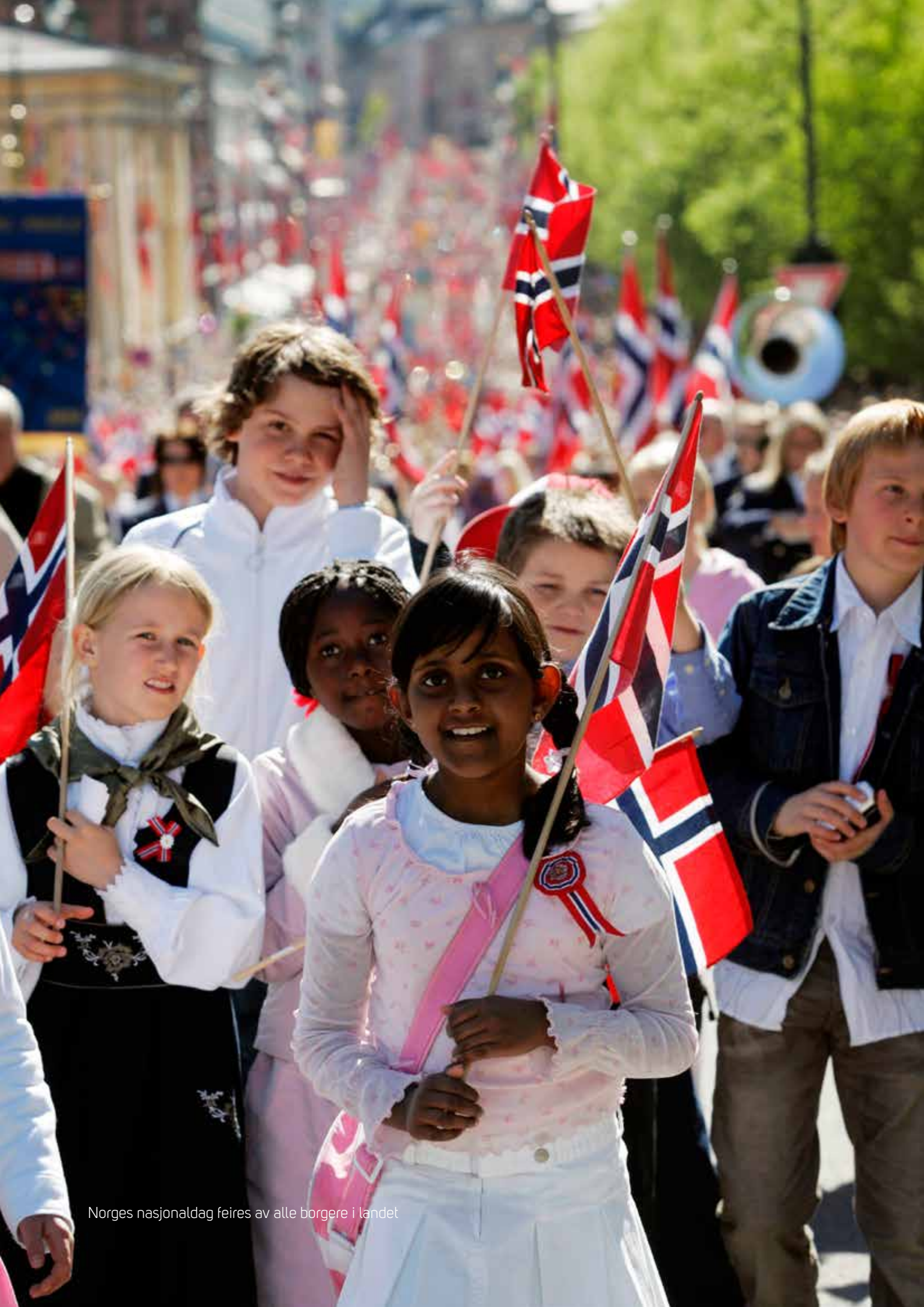
Norges nasjonaldag feires av alle borgere i landet