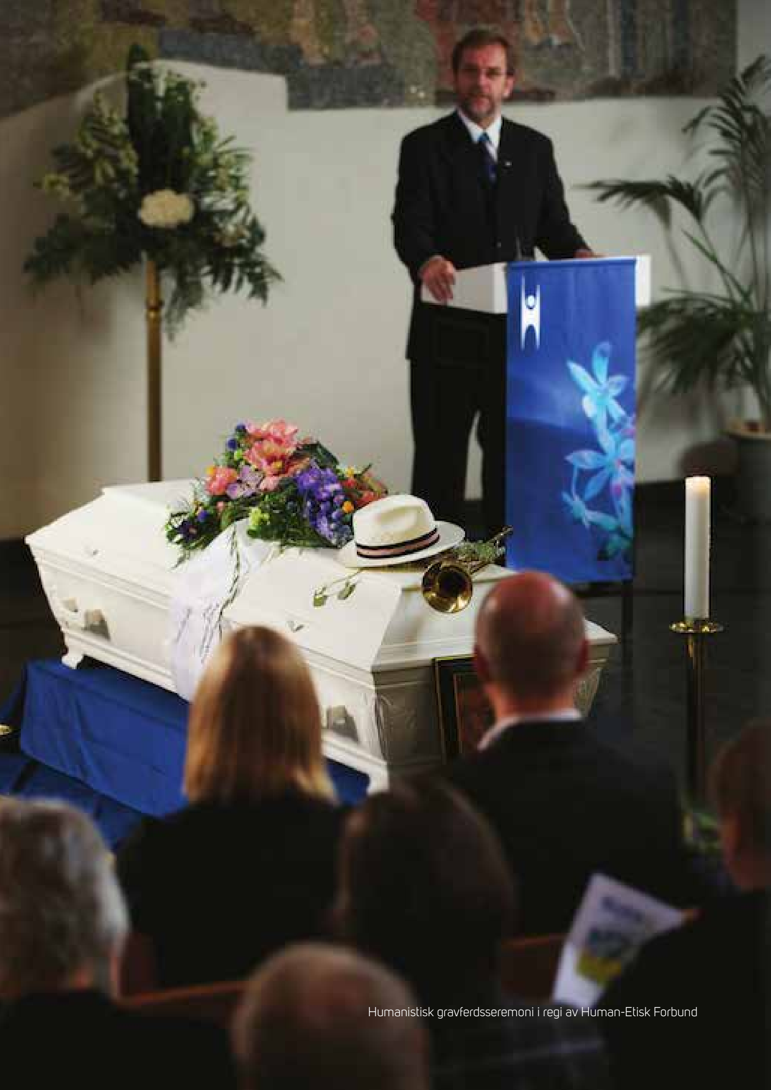
Humanistisk gravferdsseremoni i regi av Human-Etisk Forbund