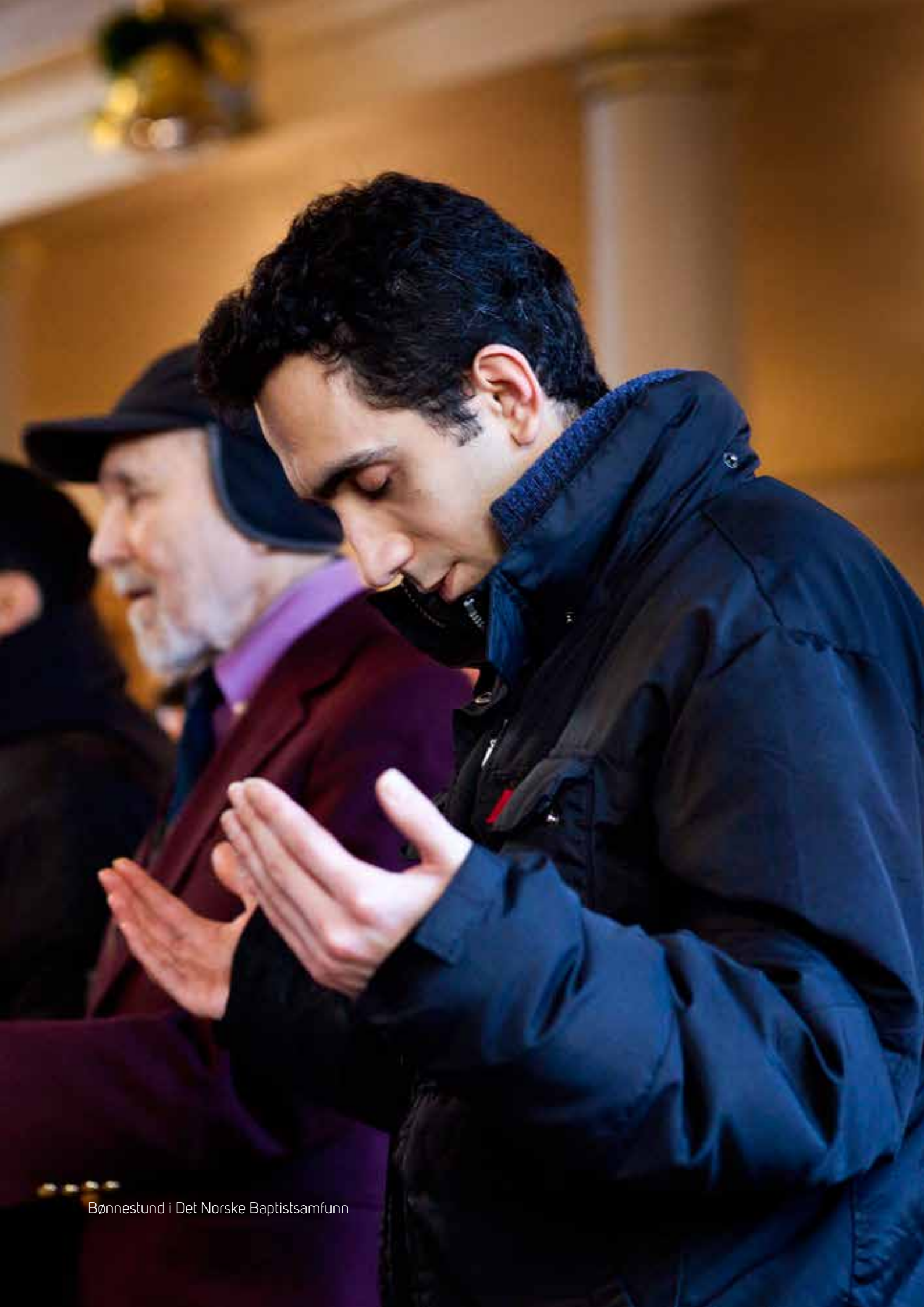
Bønnestund i Det Norske Baptistsamfunn