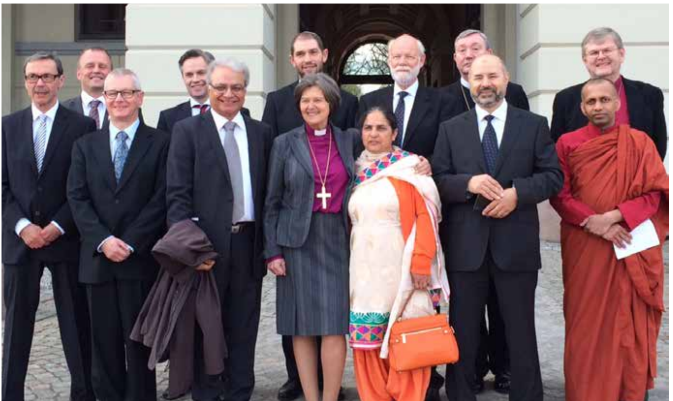
Religions- og livssynslederforumet på besøk til Slottet

6. oktober møttes religions- og livssynslederforumet til årets andre samling, denne gangen hos hinduenes Sanatan Mandir Sabh-tempel på Slemmestad. Temaet for dialogen var ekstreme aspekter i egen tro eller livssyn, og hvor grensen går mellom det gode og det destruktive i egen tradisjon.