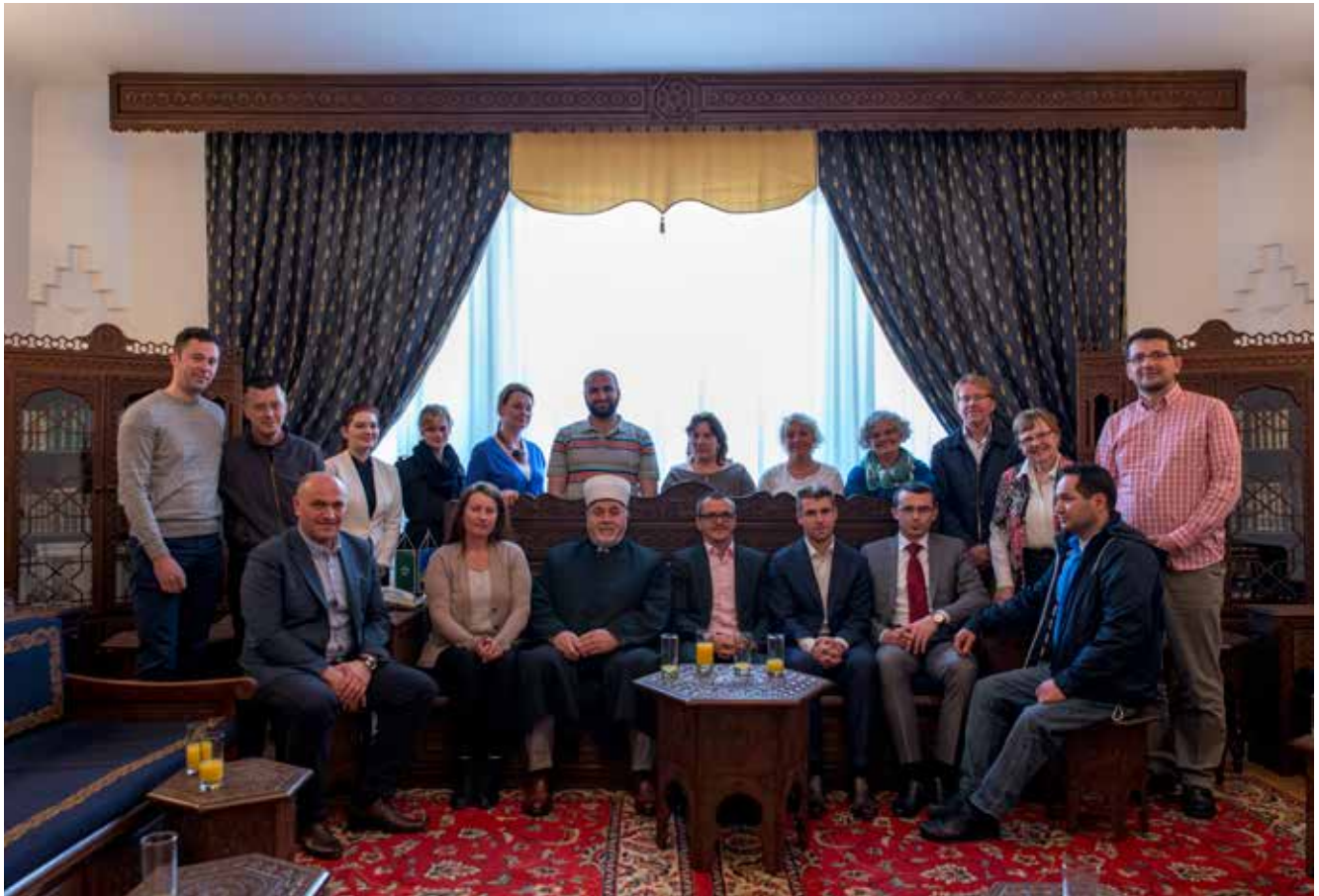
STL Bergens studietur til Bosnia og Hercegovina