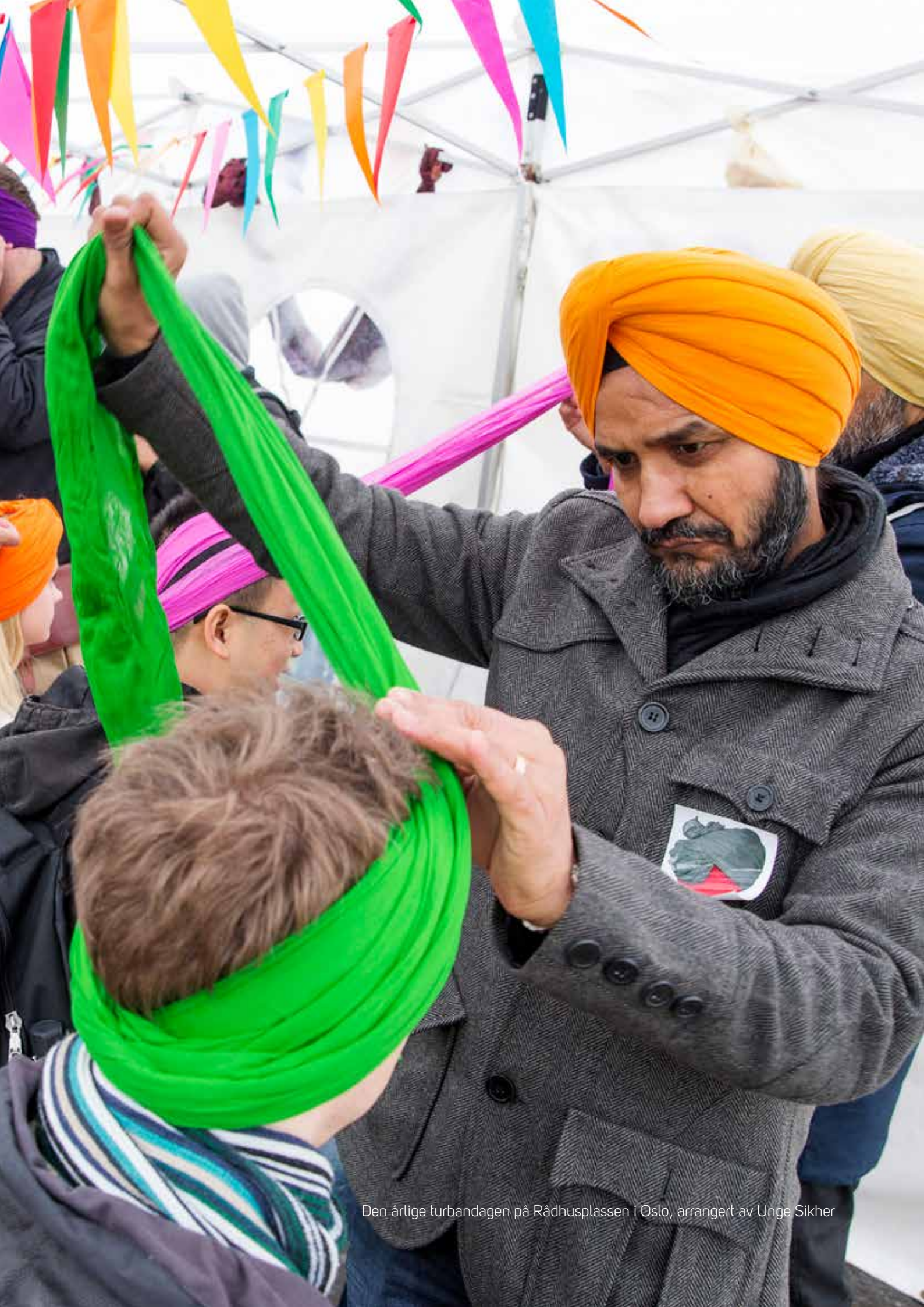
Den årlige turbandagen på Rådhusplassen i Oslo, arrangert av Unge Sikher